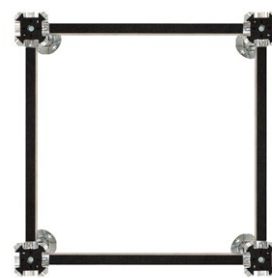
MAGLIA STRUTTURA STO

La saldatura è eseguita in modo da rendere i due elementi perfettamente uniti. Un dado con tacche antisvitamento consente la regolazione della colonna.